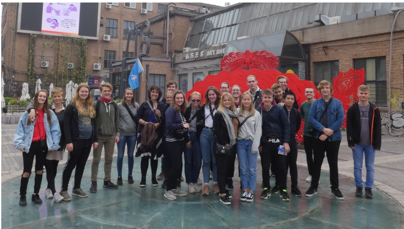
SG-elever i Kina, efteråret 2018.

Eleverne har trænet i at debattere på SG gennem vinteren, så de har været klar til forårets debatmøder.