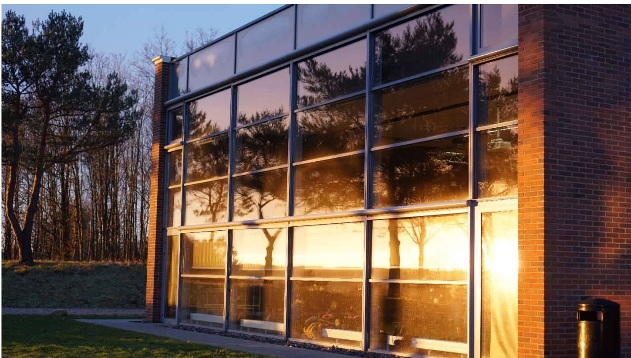
SG's KREA-fløj en frostklar januar-morgen 2019.

Som det fremgik af afsnit 2.5, blev der i foråret 2019 afholdt en særforestilling af gymnasiemusicalen ”En verden af liv” for 8. klasse-eleverne fra kommunens grundskoler. Ca. 320 grundskoleelever fra fire forskellige skoler deltog i arrangementet.