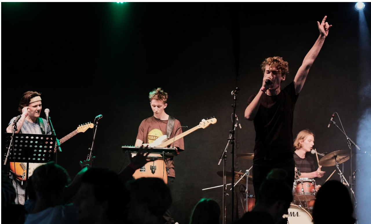
Elevband på scenen ved SGønfesten, 2018.

Igen i år afholdt vi vores egen musikfestival, SGønfest, i slutningen af august. SGønfesten afholdtes på sportspladsen og i Hal 2 og indeholdt en række sociale aktiviteter, fællesspisning og ikke mindst livemusik på den store scene ved 11 forskellige elevbands og et lærerband. Festen inkluderede også koncert med Shaka Loveless.