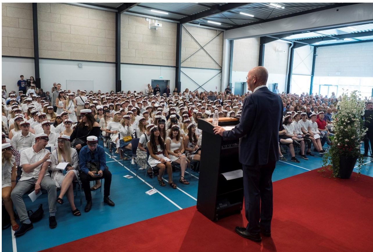
SG-studerter til dimission, juni 2018