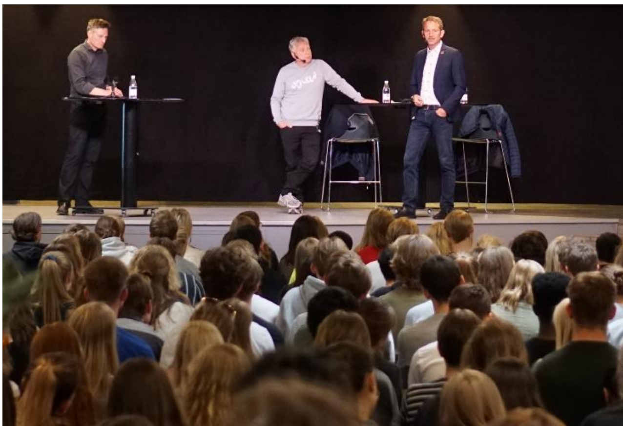
Debat mellem Uffe Elbæk og Kristian Jensen på SG, maj 2019.

Som optakt til folketingsvalget afholdtes der mandag den 13. maj debat mellem Finansminister Kristian Jensen og Alternativets politiske leder Uffe Elbæk. Temaerne for debatten var klimaudfordringen, uddannelsespolitik samt lighed/ulighed, ligesom der var mulighed for at stille spørgsmål fra salen. Som supplement hertil har mange forskellige politikere og partier haft stande i kantineområdet og uddelt materialer i forbindelse med både EP-valget og FT-valget.