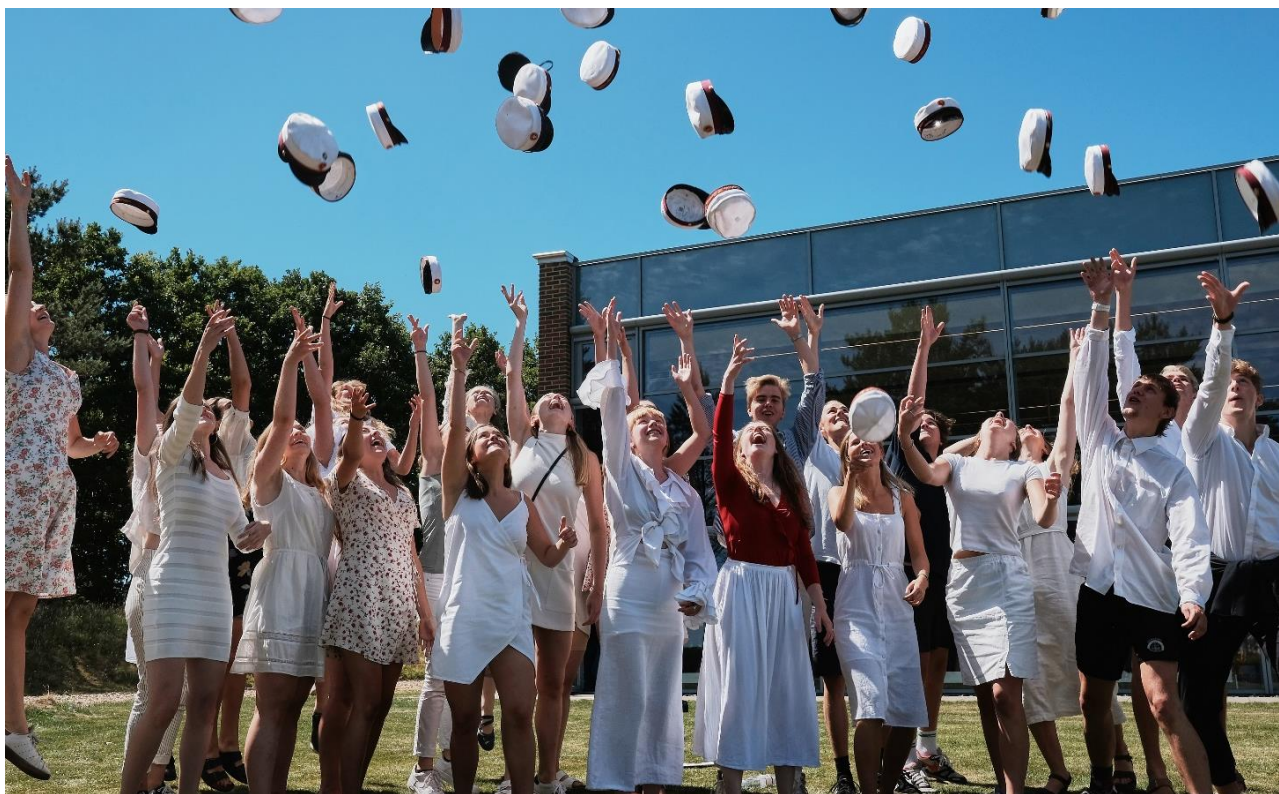
Glade SG-studenter, sommeren 2018.

Der blev igen i år afholdt studieretningsaften for elever og forældre, men denne gang afholdtes arrangementet allerede i august, så forældrene kunne være en del af vejledningsprocessen fra start. Aftenen fungerede igen i år som supplement til hhv. studieretningshæftet, fagpræsentationslektionerne og karrierelæringsamtalerne, der ligeledes afvikledes i grundforløbet.