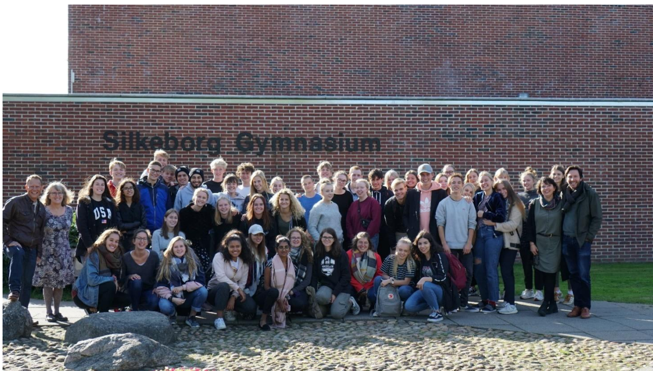
Besøg fra vores partnerskole i Schweiz, efteråret 2018.

Tre lærere har deltaget i en projektgruppe, der har undersøgt undervisningspraksis i lokale grundskoler (indhold, niveau, didaktik) med henblik på at skabe en passende progression i og motivation for tysk i 1.g. Gruppens undersøgelser og forslag bruges efterfølgende af hele tysk faggruppen. Helt konkret har projektdeltagerne samarbejdet med Sølystskolen, Vestre Skole og Trekløverskolen.