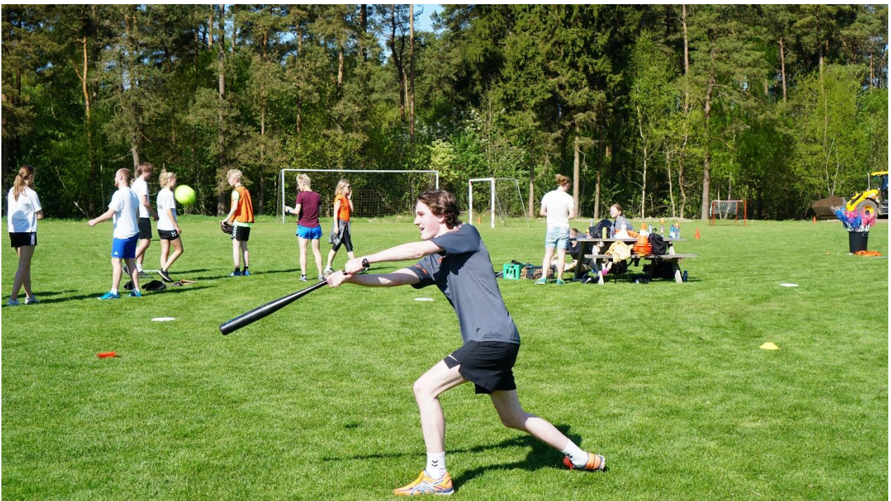
Idrætsdag på SG, efteråret 2018.