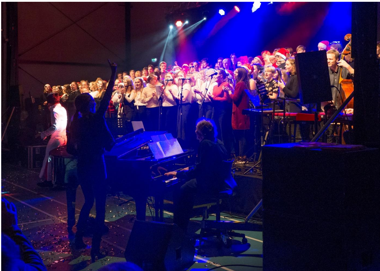
"Elvis" med kor på scenen under julekoncerten. 2018

Julekoncerten er en tilbagevendende begivenhed, hvor elever fra musikstudieretningerne og fra de frivillige musikaktiviteter afholder koncert. Også i år var julekoncerten særdeles velbesøgt.