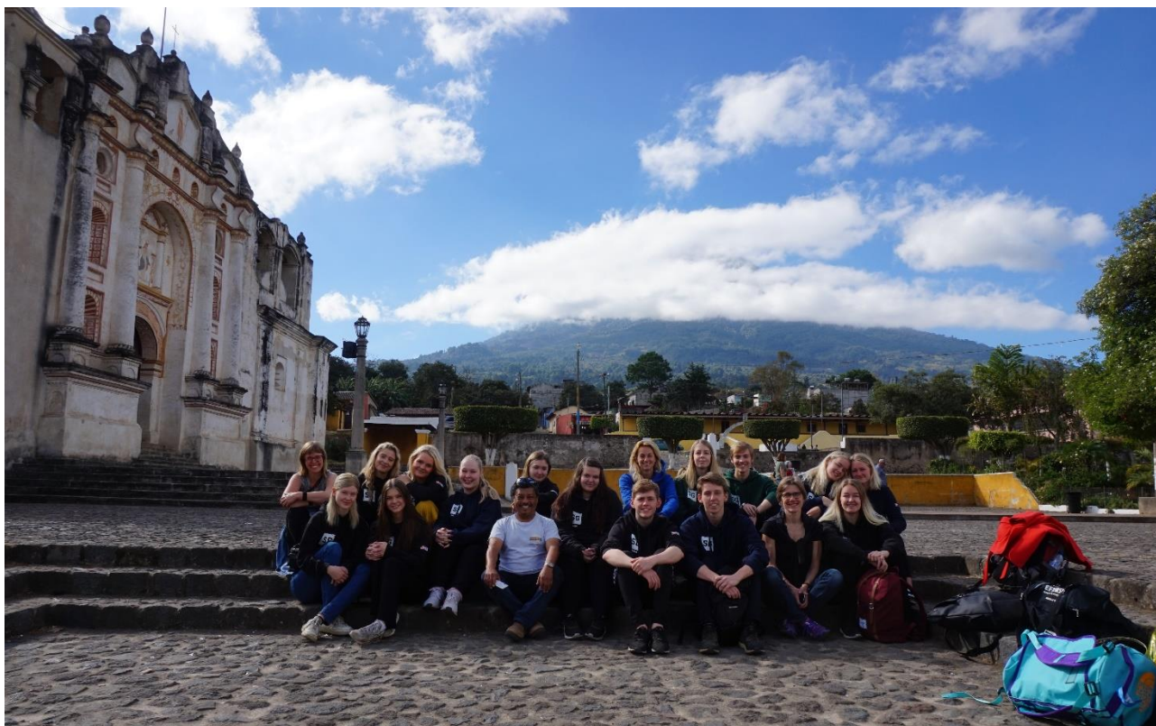
SG-elever i Guatemala, foråret 2019.