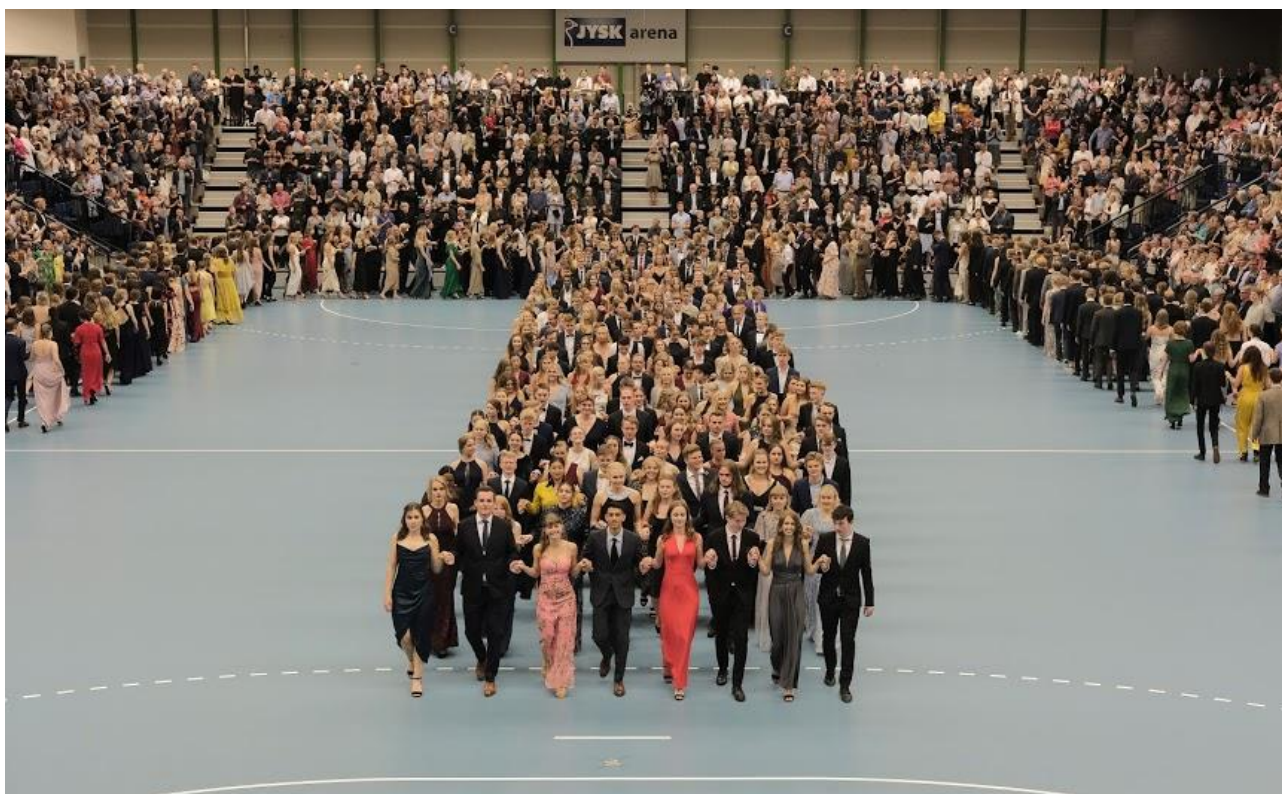
Lanciers-indmarch i Jysk Arena, maj 2019.

Undervisningsministeriet gennemfører et forsøg på 15-20 gymnasier med fokus på samarbejde mellem grupper af lærere og ledelse om specifik udvikling af undervisningen. SG ansøgte om deltagelse i projektet, idet det var planen at etablere to grupper, der i hvert sit fag arbejder med lektionsstudier. UVM imødekom ansøgningen, men ved det første fællesmøde for de deltagende gymnasier viste det sig, at projektets struktur ikke passede med planerne for SG. Derfor annullerede SG sin deltagelse.