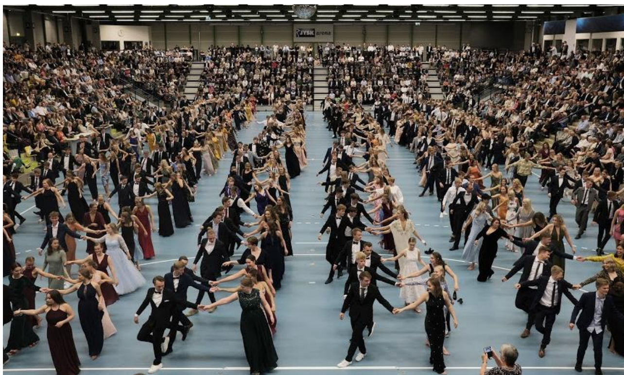
Lancers i Jysk Arena, maj 2019.

Studiestartsvejledningen forløb intensivt i perioden fra november til februar, hvor lærere og elever mødtes i studiemodulet ugentligt for at udvikle elevernes motivation og faglige arbejdsstrategier. Desuden sparrede de deltagende lærere med hinanden undervejs. Det viste sig i praksis dog svært at få skemalagt nok studietider, hvorfor mødefrekvensen blev lidt mindre end oprindeligt planlagt.