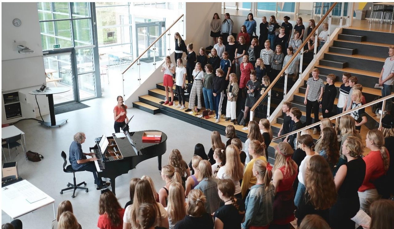
Blandt aktivitetsdagens tværgående aktiviteter var korsang i auditoriet.