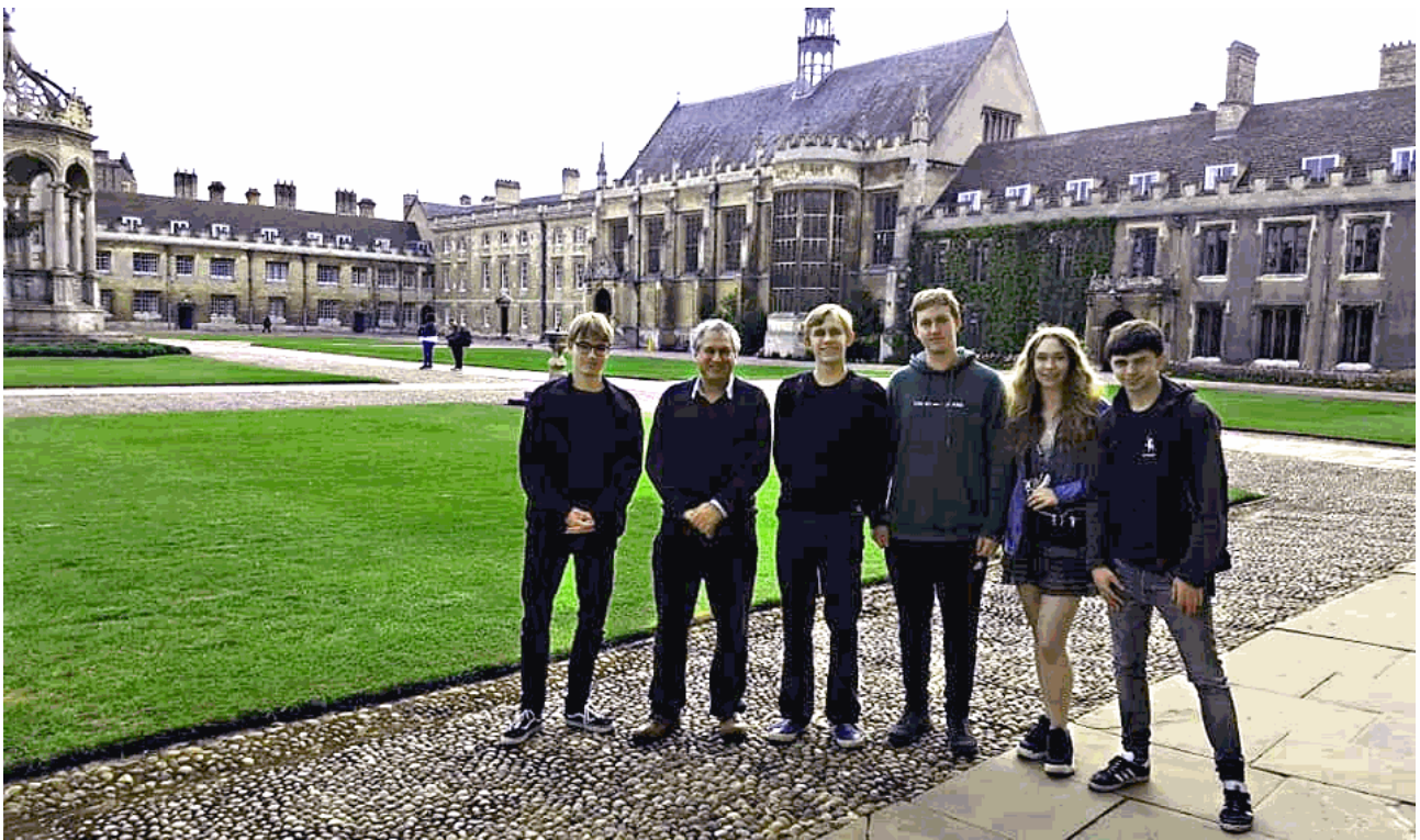
Phimurerne på tur til Cambridge, april 2019.