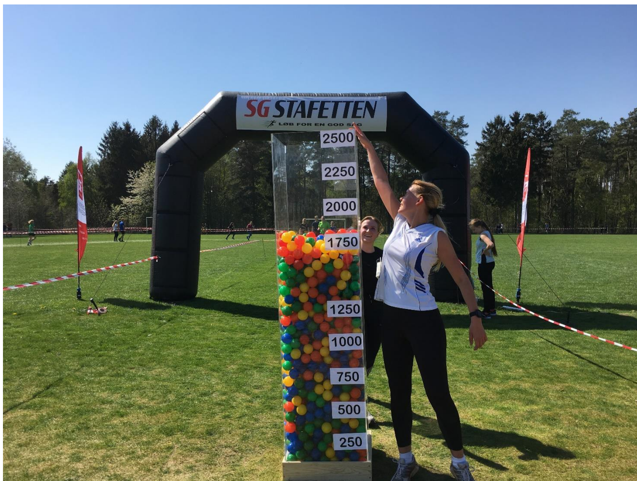
Ved SG Stafetten 2019 blev der samlet ind til Kræftens Bekæmpelse.

SG Stafetten er efterhånden blevet en fast, årlig tradition, og stafetten blev gennemført igen i april 2019. Fra start var der højt tempo med fælles opvarmning, musik i højttalerne og professionel tidstagning, og på løberuten fik en række husorkestre smilet frem hos løberne. I år afvikledes SG Stafetten som et velgørenhedsløb, hvor eleverne via private sponsorer samlede ind til Kræftens Bekæmpelse, og denne model vil også blive brugt fremadrettet.