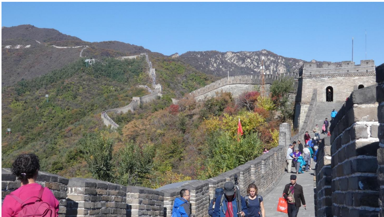
SG-elever på tur til Den Kinesiske Mur, efteråret 2018.

Derudover afholdtes et fællesarrangement med ”Sprogzonen” for alle AP-elever.