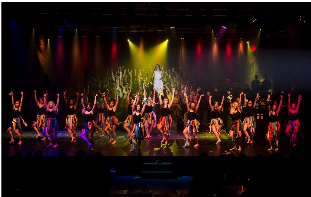
Slutscenen i årets SG-musical "En verden af liv".

Med reformen indførtes nye rammer for og krav til dansk-historie-opgaven, der fx skal være flerfaglig. På baggrund af erfaringerne fra skoleåret 2017-18 evalueredes det interne forløb, og forløbet er herefter blevet tilpasset, ligesom der er tilføjet nyt materiale.