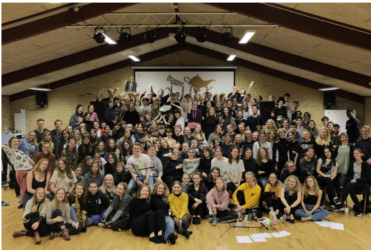
Musicalholdet på øveweekend inden premieren på ”En verden af liv”, foråret 2019.

Der blev også i efteråret 2018 afholdt gammel-elev-fest, og der var igen i år stor opbakning til arrangementet med ca. 500 deltagere.