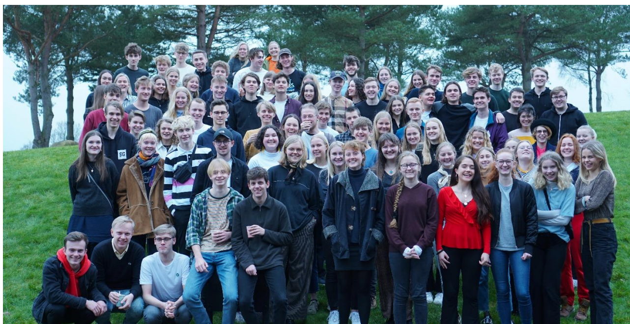
SG's elevråd, februar 2019.

Introudvalget har planlagt og udviklet introduktionsarrangementer i form af første skoledag, tutorordning, intro-tur, SG After Dark mv. Eleverne er meget positive i vurderingen af de gennemførte aktiviteter.