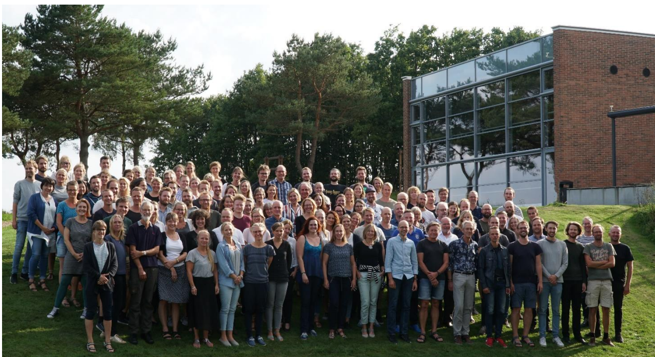
SG-lærerne samlet til fælles billede på første skoledag, efteråret 2018.