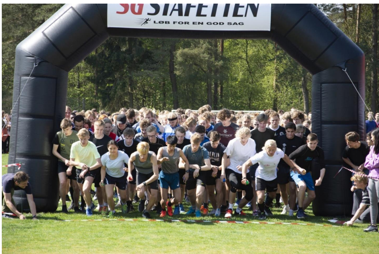
SG Stafetten 2019 sættes i gang – for første gang som et velgørenhedsløb.

For særligt litteraturinteresserede elever var der læsekreds i dansk med deltagelse af to dansklærere. Læsekredsen læste to værker i løbet af året og mødtes efterfølgende til aftenarrangementer, hvor værkerne blev analyseret, fortolket og diskuteret i fællesskab. Læsekredsen var åben for alle elever.